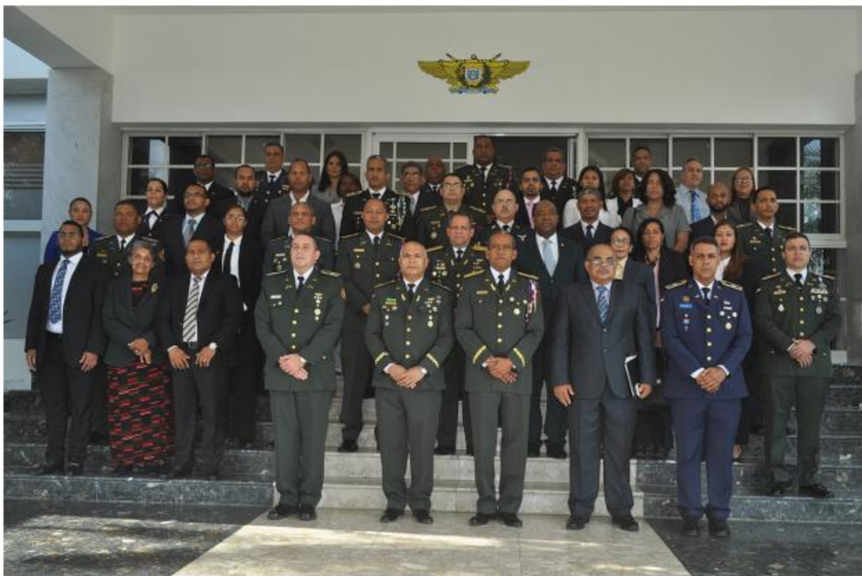
15ª Promoción de la Maestría en Defensa y Seguridad Nacional.

discentes que el Ministerio de Defensa a través del INSUDE y de estos programas académicos, se ha abierto un espacio para que líderes civiles y militares puedan profundizar sus conocimientos en estos ámbitos tan importantes.