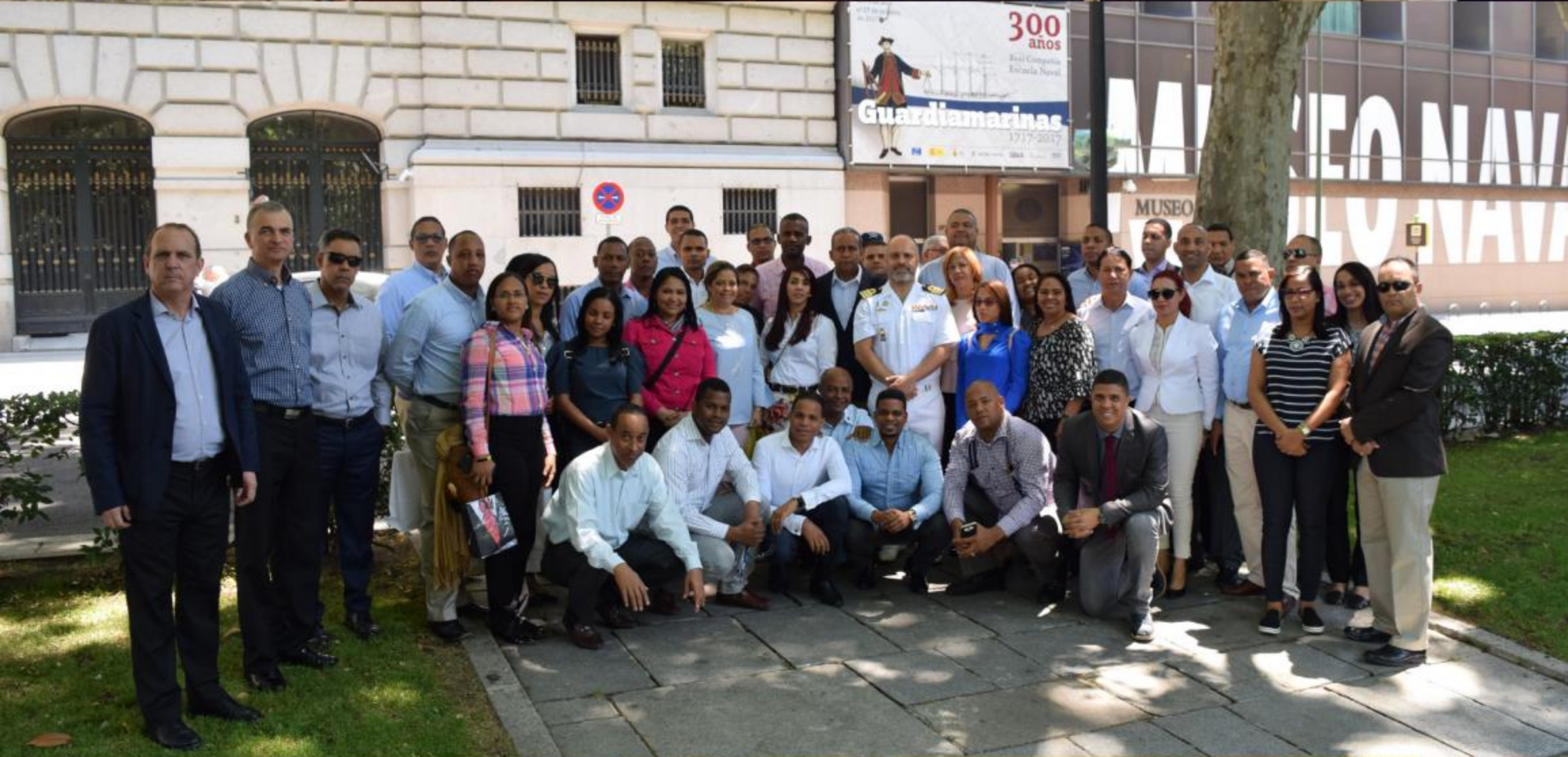
La delegación dominicana fue conducida al Museo Naval Español, la cual fue recibida por el Almirante Fernando Zumalacarragui Luxan.