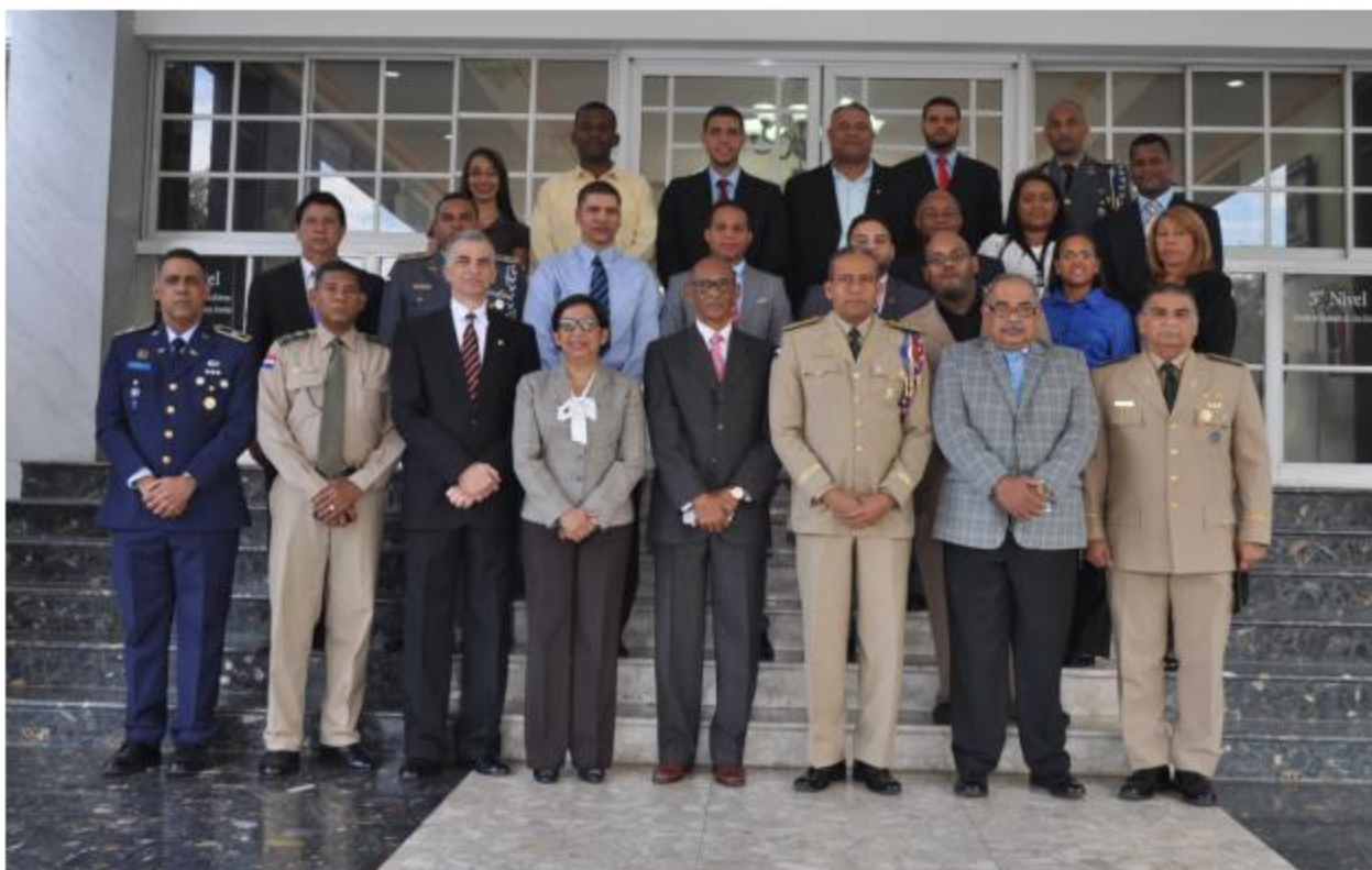
10ª Promoción de la Especialidad en Geopolítica.