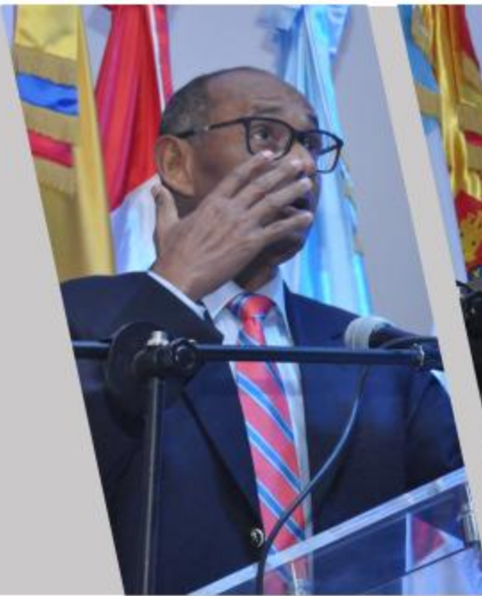
Mayor General (r) Adriano Silverio, E.N.