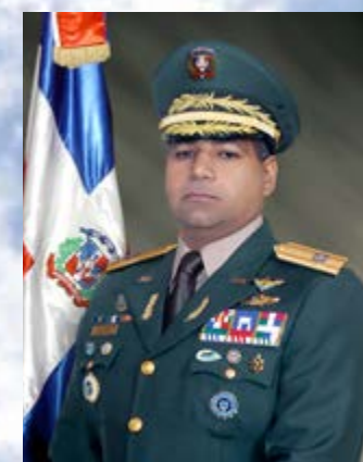
Teniente General, ERD. Rubén Darío Paulino Sem Ministro de Defensa de la República Dominicana.