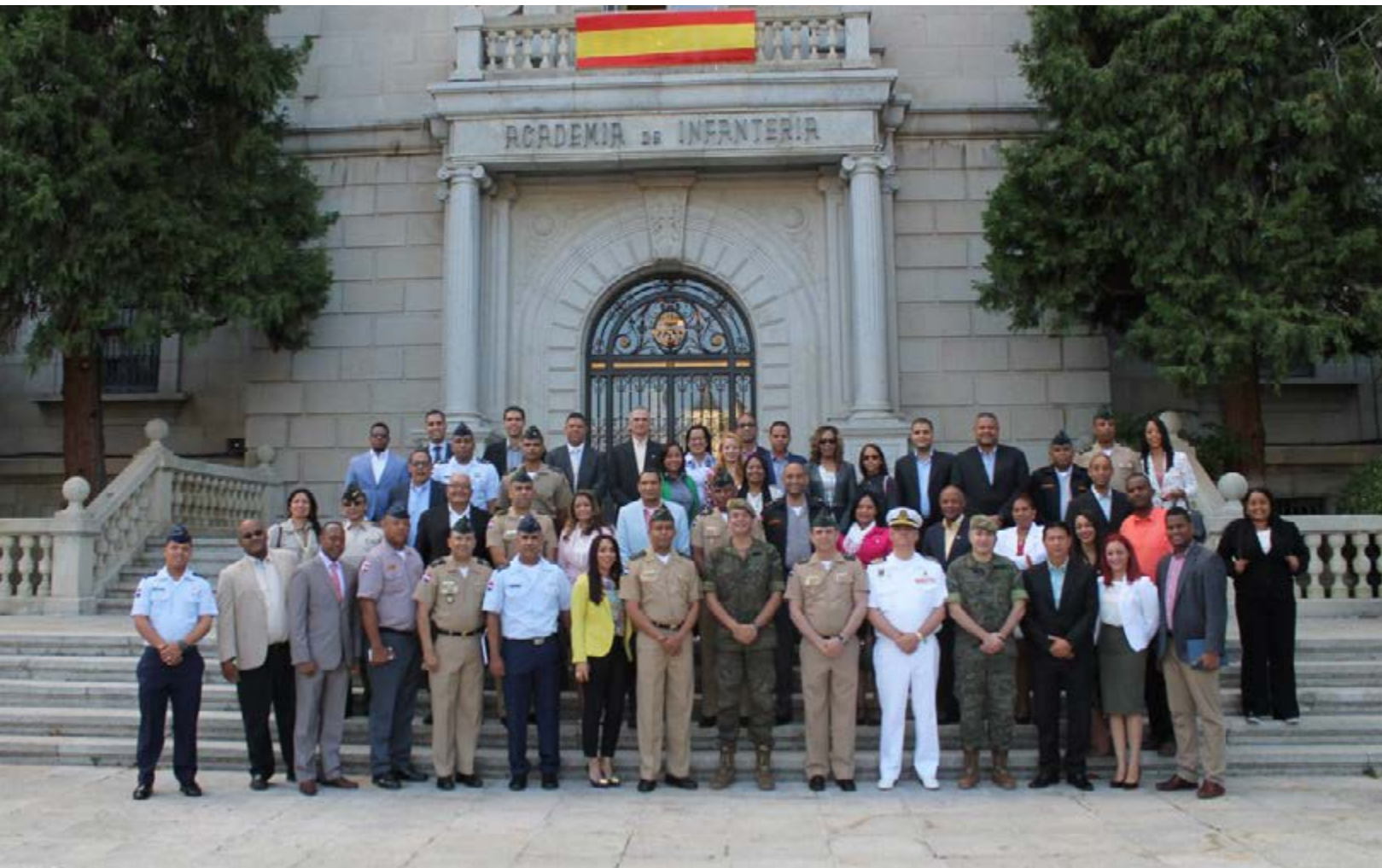
Academia de Infantería de Toledo, España.