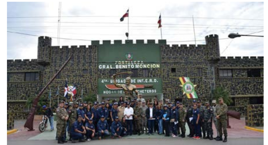
Cuarta Brigada de Infantería del Ejército de República Dominicana, provincia Mao.