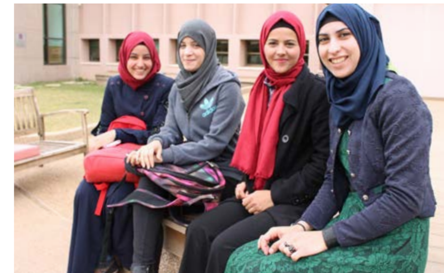
"El Estado de Israel es el único país del mundo en el que el servicio militar obligatorio se aplica también a mujeres".