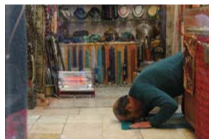
"En el caso de los Palestinos, proponen Jerusalem sea la capital de ambos países, por ser soberanos ambos Estados; en su corazón reposan los lugares santos y entienden debe haber un régimen especial apoyado por la comunidad internacional, renunciando a la soberanía nacional, para que estén bajo la soberanía de Dios".

abrumadora, unos 100 millones de personas no tiene trabajo y hay jóvenes que llegan a los 50 años de sus vidas, sin haber trabajado producto de los conflictos. Mientras, la Fuerzas de Defensa de Israel, procuran usar tecnologías de avanzada, soldados vigilantes y sistemas de inteligencia ante una guerra que consideran "asimétrica" porque las organizaciones terroristas usan a las poblaciones civiles como escudos para sus ataques en Gaza y Líbano.