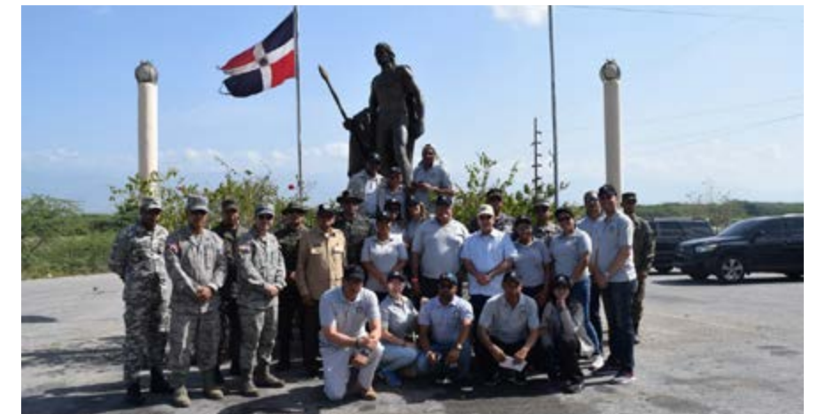
Monumento a Enriqueillo, cruce Barahona, Duvergé y Neyba, recorrido frontera sur realizado del 23 al 24 de agosto de 2017.