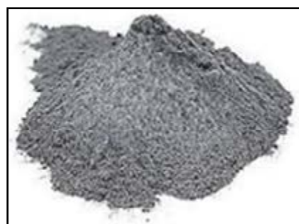
Polvo de Aluminio