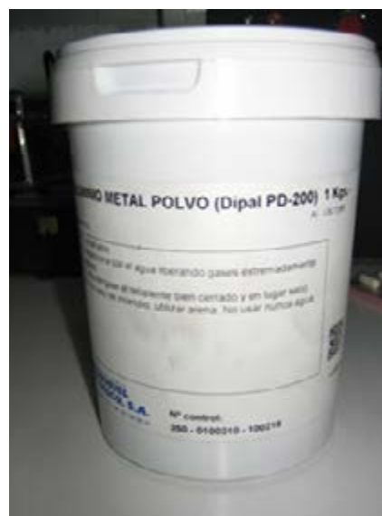
Polvo de Aluminio

Polvo de Aluminio , es un metal que se transportara como una sustancia química, es altamente inflamable creado a partir de aluminio en granos finos, se utiliza en la fabricación de productos eléctricos, y en la producción de explosivos.