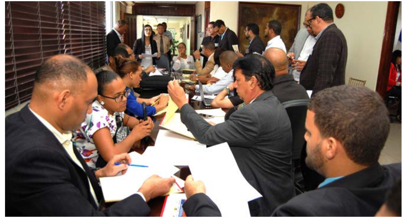
Durante el ejercicio que suele realizarse cada año con las promociones de turno, se plantea una situación de crisis hipotética, ante la cual los grupos de trabajo deben ofrecer soluciones.