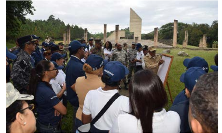
Visita al Monumento de Capotillo durante el recorrido frontera norte, realizada del 9 al 10 de noviembre de 2017.

Acercarse a las condiciones del área visitada, incluyendo su población nativa y extranjera, situación de los recursos naturales, la presencia militar en la zona, aspectos relativos a la migración haitiana, así como debilidades y fortalezas del paso fronterizo, permiten a los estudiantes tener una idea de la gran responsabilidad y planificación necesaria para garantizar el orden en esas demarcaciones geográficas.