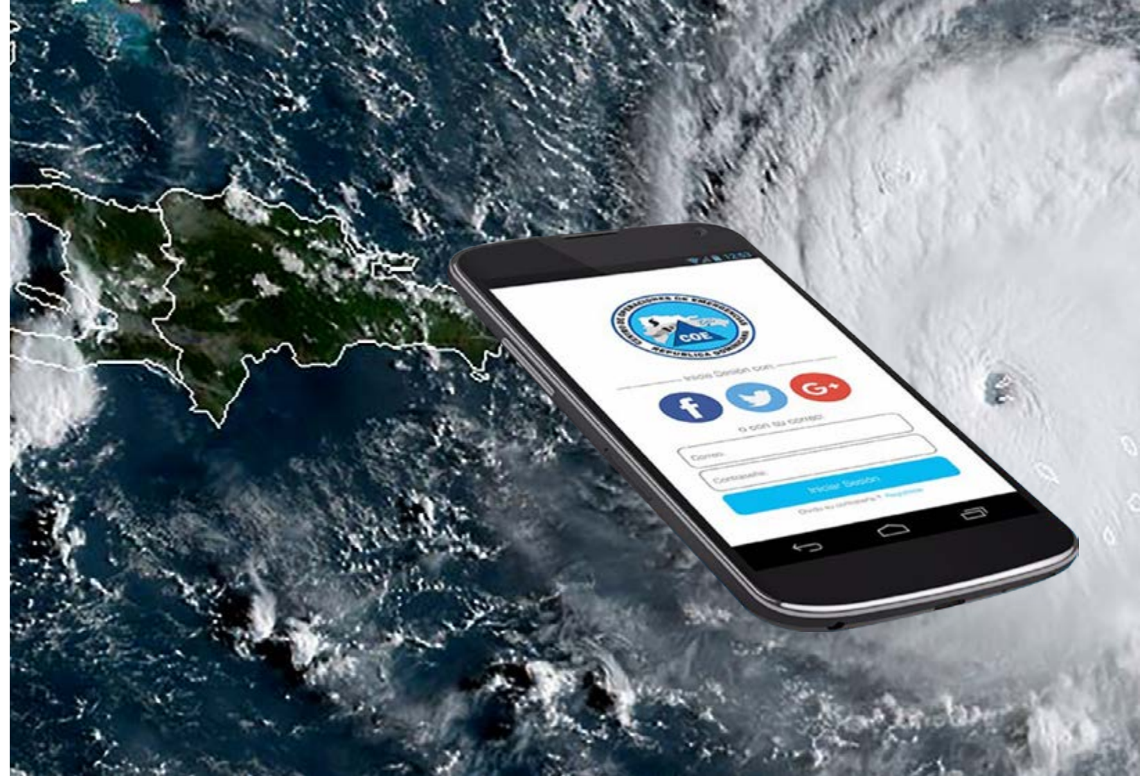
La APP Alerta COE, es un recurso informativo digital que se ha convertido en una herramienta útil para la ciudadanía en situaciones de emergencias.

Para comprender el flujo de las informaciones que maneja el COE, debe saberse que primero pasan por quienes administran el poder político y luego descienden al estratégico, al operativo y finalmente al público. Por tanto, temas relativos a la disponibilidad de hospi-