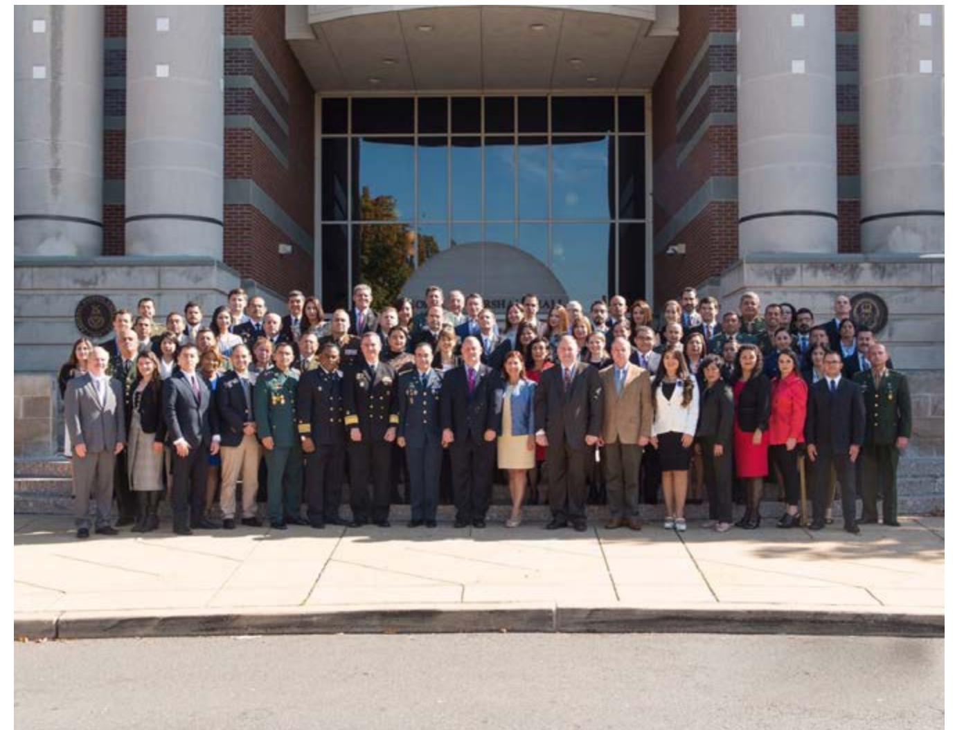
Participantes del curso Estrategia y de Política de Defensa (SDP).