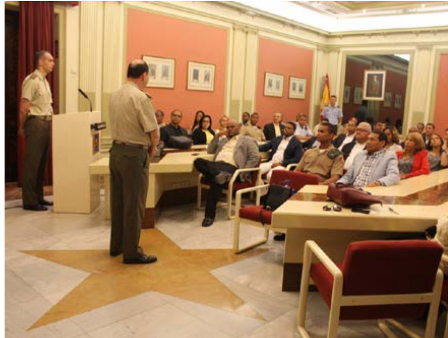
Cuartel General del Ejército de Tierra, Madrid, España.

Cursantes de la 14ª Promoción de la Maestría en Defensa y Seguridad Nacional y de la 10ª Promoción de la Especialidad en Geopolíticos, participaron del 27 de mayo al 3 de junio del 2017 en un interesante viaje académico a la ciudad de Madrid, que incluyó la visita de la Academia de Infantería de Toledo, la Base Aérea de Torrejón de Ardoz, sede principal a la Unidad Militar de Emergencias (UME), la empresa de tecnología aérea y espacial AIRBUS, los Cuarteles Generales de la Armada y el Ejército de Tierra de España, el Museo Naval y la Universidad de Nebrija, institución con la cual el INSUDE firmó acuerdos de cooperación e intercambio académico.