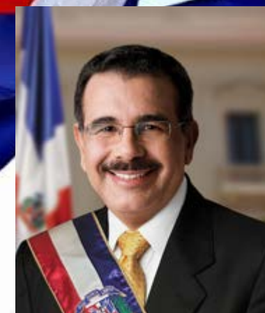
Licenciado Danilo Medina Sánchez Excelentísimo Presidente Constitucional de la República y Autoridad Suprema de las Fuerzas Armadas y la Policía Nacional.